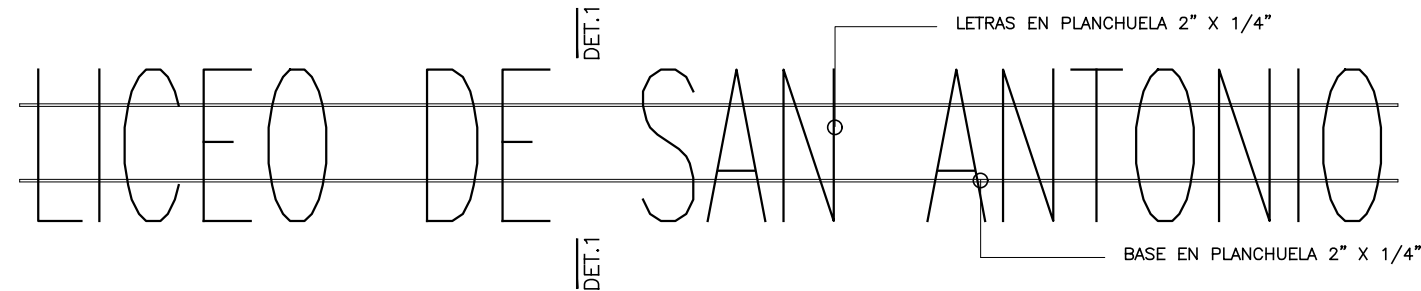
VISTA FRONTAL ESCALA: 1/20